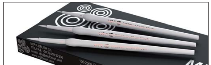
Codice No. 105-1000 MPF Zirconia Stain 3-in-1 Brush Kit